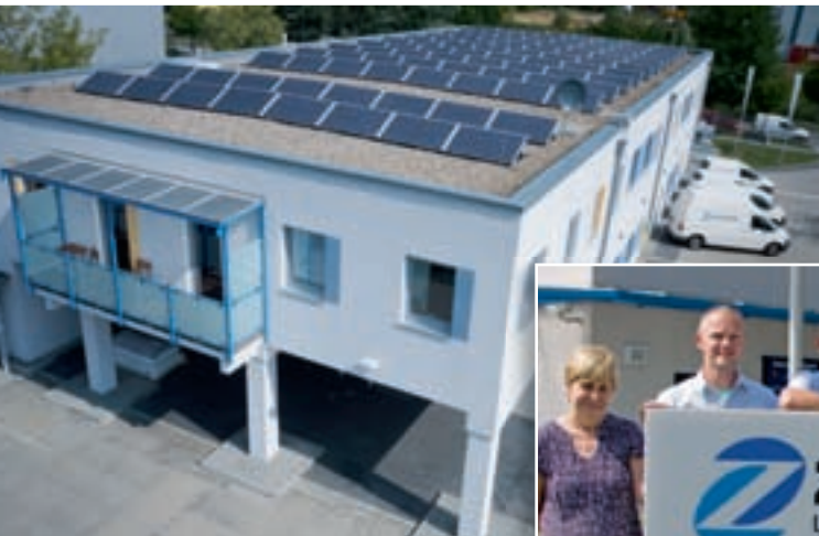
BACKOFFICE: das Mitarbeiterteam der Firma Zühlsdorf.